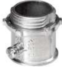
EMT Copla Unión Zinc