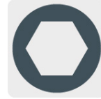
Broca piloto ajustable