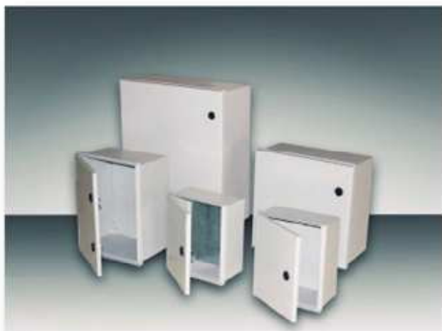
Tablero Poliester de una sola puerta