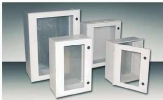
Tablero Poliester con puerta de vidrio.