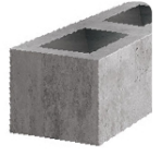
Punta de cruz