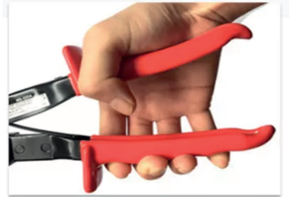
2. Presiona el mango repetidamente Para conducir la cuchilla para cortar.