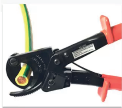
1. Coloca el Cable.