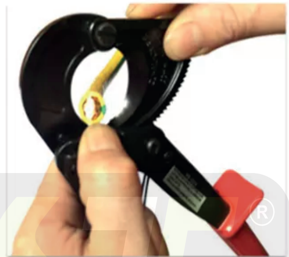
4. Saque la Hoja.