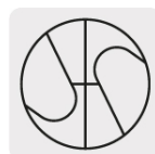
Punta Split Point